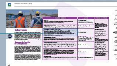
Aguas Andinas Reporte Integrado 2022, página 99 lector pdf

El sistema está certificado bajo la norma ISO 37001.