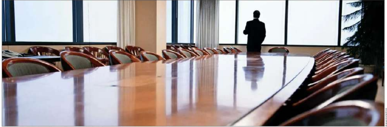
El informe cuenta con las respuestas de 72 ejecutivos de 60 grandes empresas locales.

El informe fue elaborado por Azerta Propósito & ESG y Acción Empresas. Hicieron consultas a 72 ejecutivos de 60 grandes compañías locales, pertenecien-