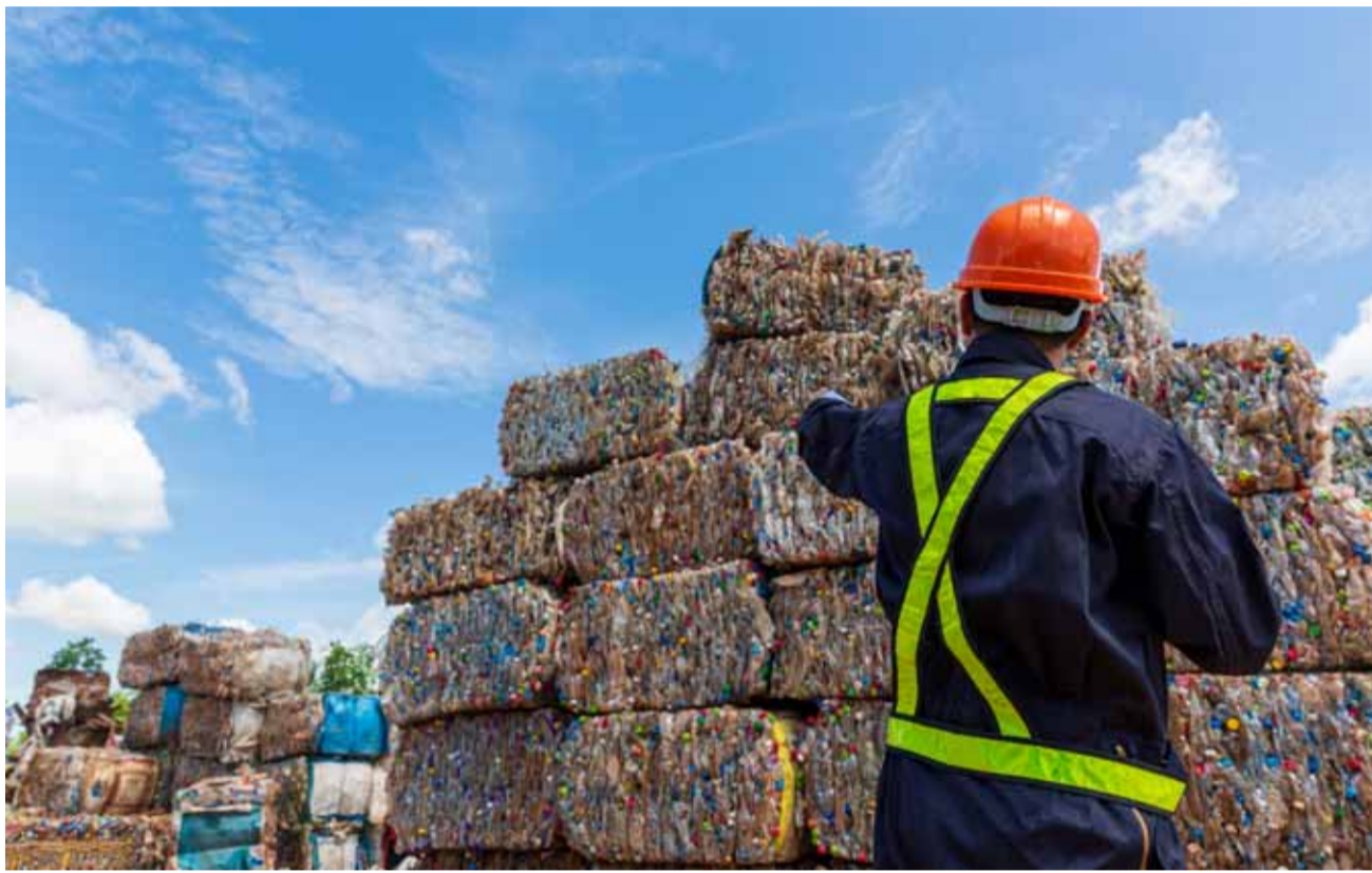
La economía circular insta a dejar atrás lo lineal y pasar a un proceso productivo en el que nada sobra y, por ende, nada se desecha.

Los Indicadores de Transición Circular (CTI) no solo son un marco y una herramienta transparente que ha permitido que casi dos mil organizaciones trabajen en objetivos y métricas universales en materia de circularidad, sino que además representan un sistema de gestión que