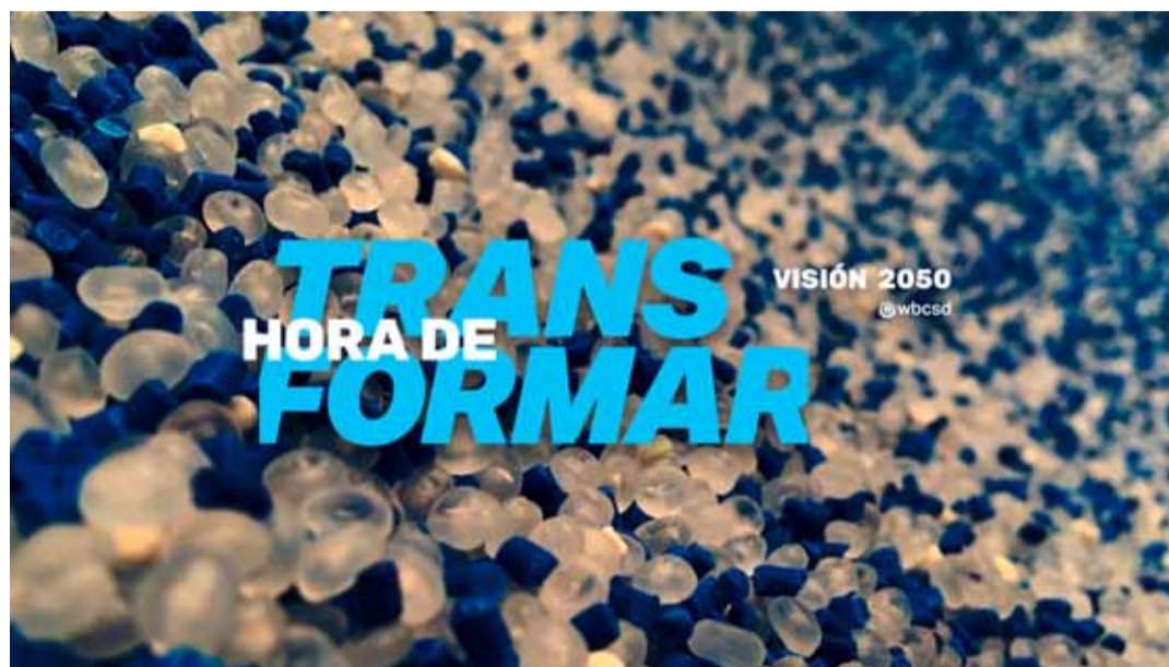
Acción Empresas basa su trabajo de sostenibilidad empresarial en los lineamientos de la "Visión 2050" del WBCSD, una guía estratégica para las empresas.

personas vivan bien dentro de los límites planetarios a mediados de siglo, transformar el cómo se produce es fundamental. Crear productos comerciales incorporando un enfoque ambiental en su diseño es una transformación que las empresas no solo pueden hacer, sino también liderar.