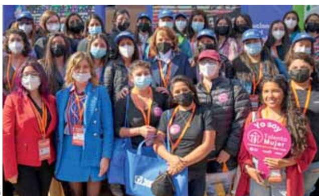
Con la presencia de la ministra de Minería, Marcela Hernando, se dio el vamos a “Talento Mujer”.