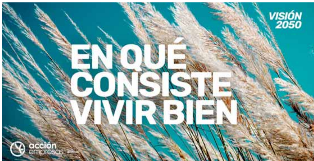
“Visión 2050” ayuda al sector privado a propiciar los cambios necesarios ante los riesgos globales que enfrenta, con un objetivo definido: “Permitir que a mediados de siglo más de 9 mil millones de personas vivan bien dentro de los límites planetarios”.

La desigualdad ha sido priorizada como uno de los tres riesgos globales que acechan nuestro futuro. Organismos como el World Economic Forum o el World Business Council, la ubican como una sombra que aumenta peligrosamente conflictuando a tal punto el bienestar, que hace tambalear la continuidad de los negocios y, por cierto, la gobernabilidad. América Latina sabe de eso. Europa, Asia y Estados Unidos, también. Fuertes quiebres sociales han recorrido el mundo, poniendo a prueba la efectividad y la legitimidad del sistema político y de la democracia para encontrar soluciones que satisfagan las necesidades de sociedades cada vez más cansadas y dispuestas a la fractura.