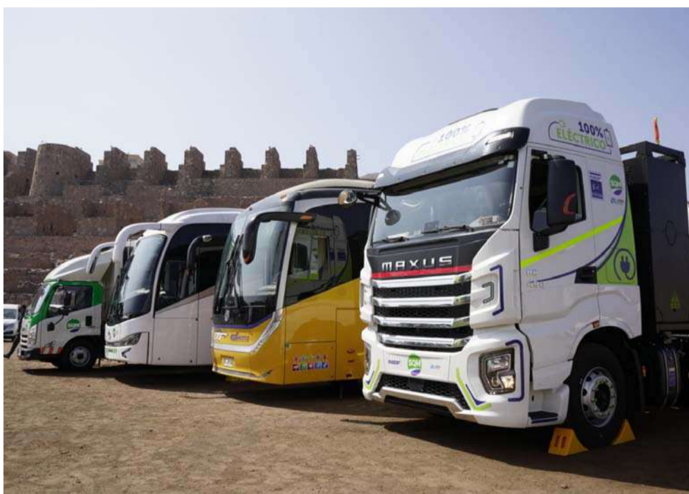
La flota eléctrica fue presentada en Antofagasta, con la presencia de autoridades, ejecutivos y representantes de las organizaciones que encabezan esta implementación a nivel nacional.

Con este hito, la compañía continúa dando importantes pasos en esta materia, donde destaca su participación en el acuerdo nacional público-privado