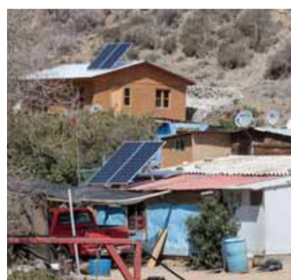
El primer proyecto de la fundación en Chile se desarrolla actualmente en la comunidad de pescadores ubicada a pocos kilómetros del parque eólico Punta Palmeras de ACCIONA Energía.

La fundación siempre respeta los mismos criterios genéricos, pero los