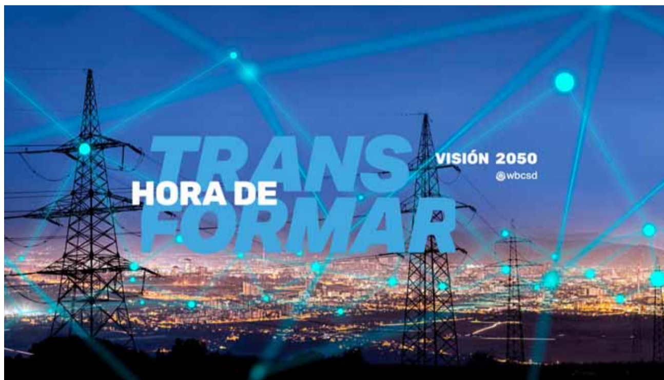
La Visión 2050 es una hoja de ruta concreta para que el sector empresarial lidere las transformaciones que necesitamos.

La citada transición verde que muchos países ya están impulsando, demostró que aún está lejos de ofrecer lo que se