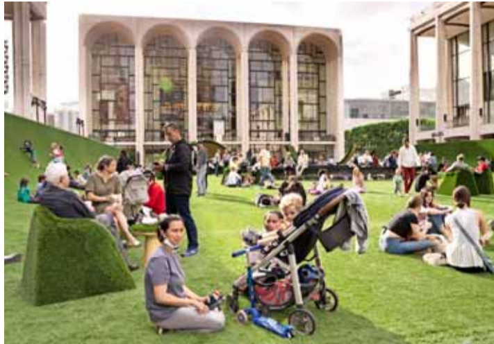
Territorios más resilientes, circulares, inteligentes, inclusivos y conectados es esencial para el desarrollo sostenible.

En Chile, el relacionamiento entre empresas y territorios ha sido un camino de mucho aprendizaje. Por años, acciones de filantropía o el desarrollo de iniciativas que no siempre respondían a una estrategia de negocios llevaron a tensionar y derechamente a romper proyectos importantes. Hoy, en un contexto mucho más desafiante, sumado a los marcos nacionales e internacionales que rigen la labor empresarial como el