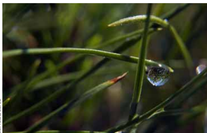
Empresas Copec y sus filiales realizan acciones urgentes para enfrentar los desafíos planetarios.

En el ámbito energético, Copec, que actualmente lidera en electromovilidad mediante Copec