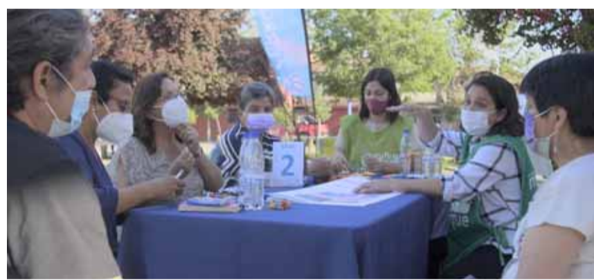
El trabajo colaborativo con la comunidad fue clave para concretar el proyecto.

Las ideas de la comunidad se materializaron en la recuperación de cuatro sectores: Santos Medel, Araucanía, Mapocho y Lo Duarte, donde se presentaban problemas estéticos y funcionales, falta de vegetación, riesgos de seguridad por falta de iluminación y de