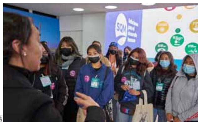
130 mujeres de distintas localidades del norte del país conocieron las oportunidades laborales de la industria minera y energética.

“Estamos muy contentos con la exitosa convocatoria del primer encuentro de vinculación laboral de minería y energía ‘Talento Mujer’, que nos permitió conocer a distintas mujeres