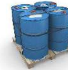
Tambores, bidones, envases peligrosos