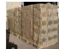
Films de transporte