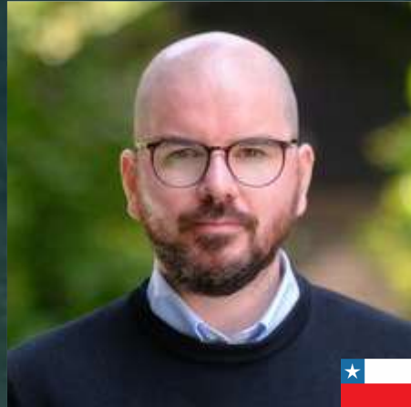
GIORGIO JACKSON Ministro Desarrollo Social Gobierno de Chile