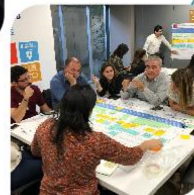
Taller ODS N° 16 – Paz, justicia e instituciones sólidas Ministerio Secretaría General de la Presidencia ACNUDH – PNUD..

Con partes interesadas desarrollados en colaboración con el sistema de Naciones Unidas – Chile