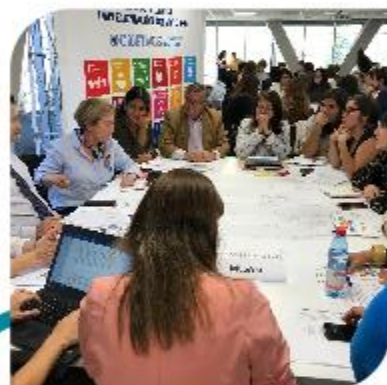
Taller ODS N° 4 – Educación de calidad Ministerio de Educación UNESCO – UNICEF.