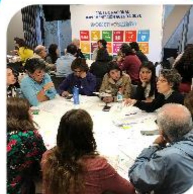
Taller ODS N° 8 – Trabajo decente y crecimiento económico Ministerios de Trabajo y Economía PNUD – ACNUDH.