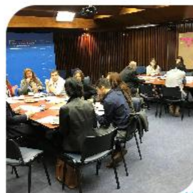
Taller ODS N° 10 – Reducción de las desigualdades Ministerio de Desarrollo Social y Familia PNUD – ACNUDH