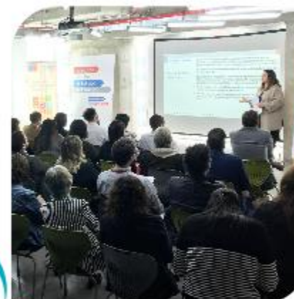
Taller ODS N° 13 – Acción por el clima Ministerio de Medio Ambiente FAO – PMA