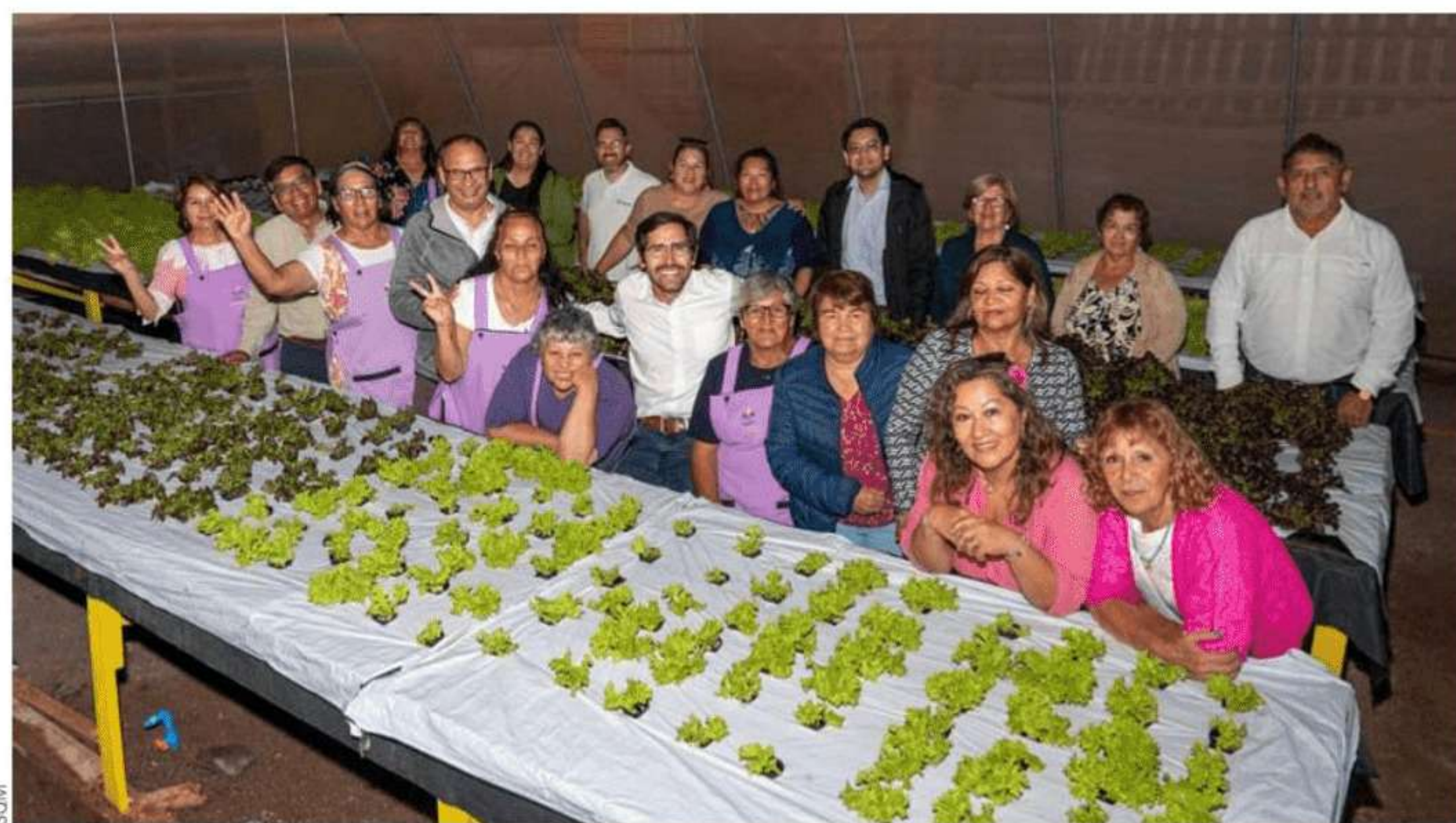
Invernadero de “Las Urqueñas” contará con energía fotovoltaica y baterías de litio para su almacenamiento.

La compañía ratificó su compromiso con la inclusión y el fomento de la participación femenina, que al cierre de 2022 alcanzó un 20% como resultado de distintas acciones concretas. Logro que fue valorado en una nueva conmemoración del 8M con una variada agenda programática bajo el lema “Vamos por + mujeres en minería”.