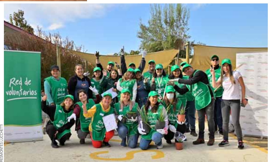
Red de Voluntarios de Tresmontes Lucchetti en Jardín Papelucho de Casablanca.

Otros de los programas que impulsa Tresmontes Lucchetti en beneficio de la comunidad es el Voluntario Corporativo, que involucra a sus colaboradores para que puedan contribuir de manera activa en los proyectos relevantes de la sociedad. Recientemente, la compañía desarrolló un voluntariado que construyó cinco espacios de naturaleza para el desarrollo integral de 170 niños y niñas en jardines infantiles de Casablanca y Valparaíso, en el marco de la implementación del Proyecto Naturalizar que realiza en alianza con Fundación Ilumina.