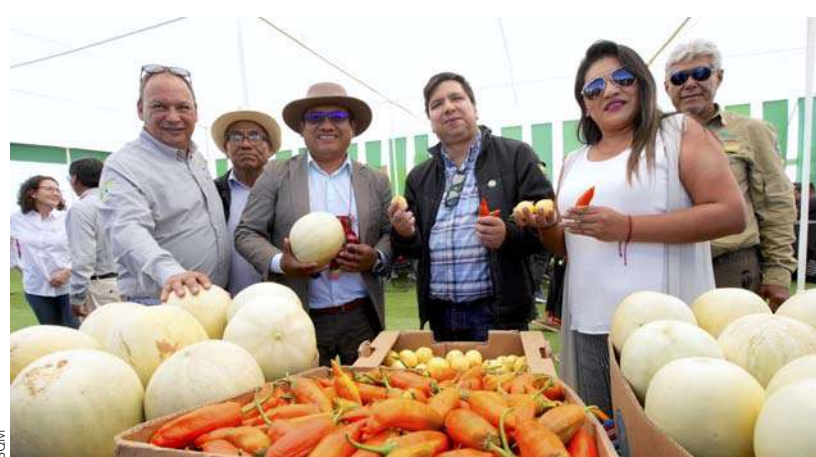
Durante la ceremonia, las agrupaciones agrícolas dieron vida a una exposición de sus productos.