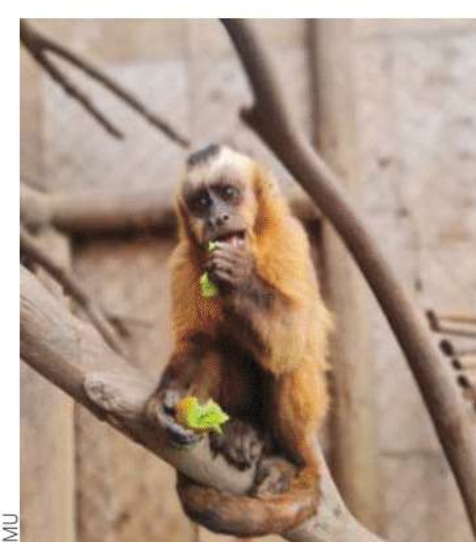
Las iniciativas de no desperdicio de alimentos de SMU y filiales también contempla la donación a centros de protección de primates.

ReSimple. Recientemente la compañía obtuvo el certificado de Giro Limpio, programa administrado por la Agencia de Sustentabilidad Energética y financiado por el Ministerio de Energía, por su compromiso en la adopción de tecnologías para mejorar el