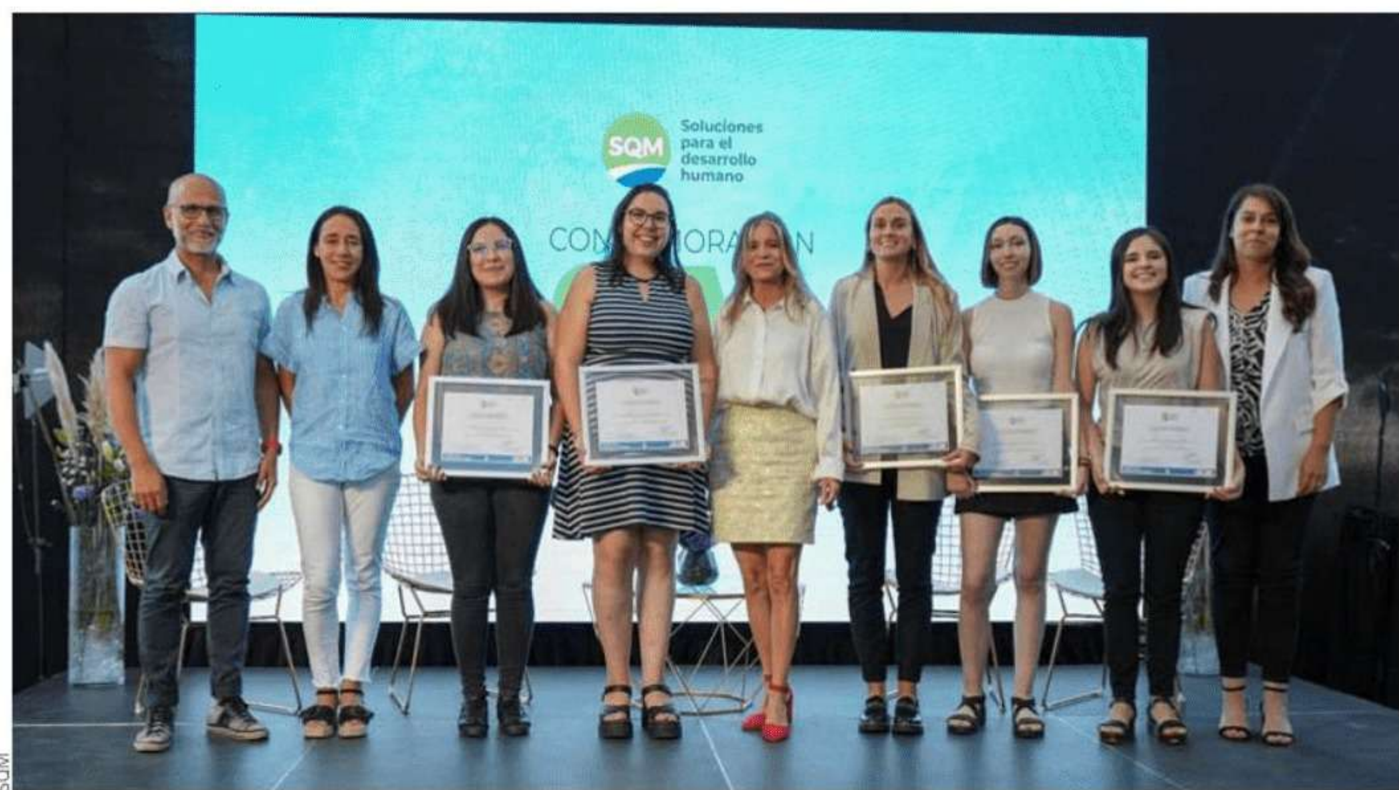
SQM certificó a 15 jóvenes que desarrollaron el Programa de Vinculación Laboral Mentoring.

Con una serie de actividades, la compañía conmemoró el Mes de la Mujer con el programa “8M: Vamos por + mujeres en minería” que se desarrolló en Santiago, Iquique, Antofagasta y María Elena, entre otras localidades.