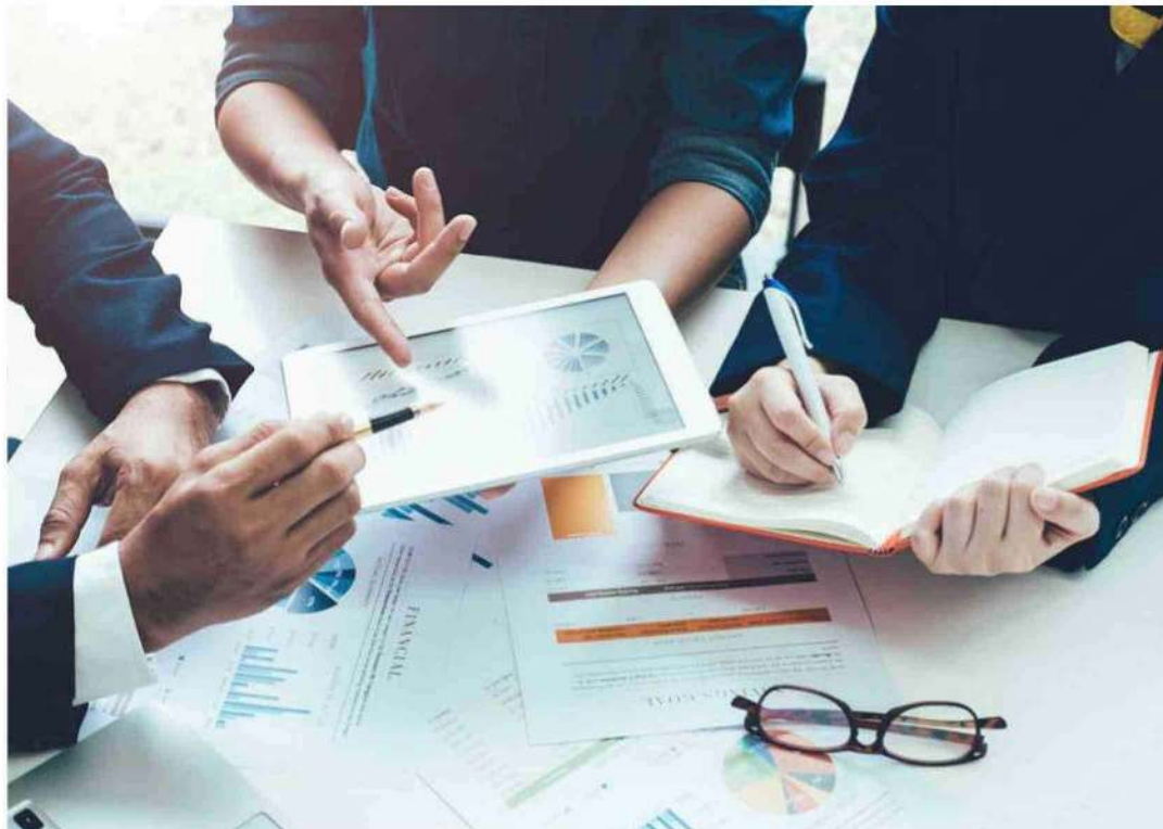
El reporting corporativo, como herramienta de gestión y comunicación, transparenta el desempeño de la empresa en áreas económicas, ambientales y sociales, y permite dar a conocer su impacto en múltiples grupos de interés, ayudándole a evaluar sus oportunidades de mejora.

De hecho, un 93% de las empresas a nivel mundial ha mejorado sus reportes de sostenibilidad entre 2019 y 2022, según el informe anual que elabora el Consejo Mundial Empresarial para el Desarrollo Sostenible,