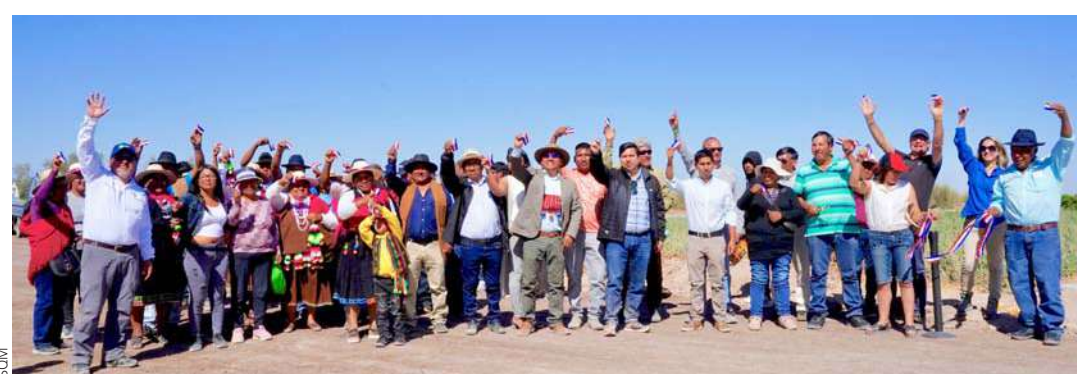
Un total de 12,5 kilómetros fueron remodelados para mejorar la conectividad de Bajo Soga con el resto del territorio.