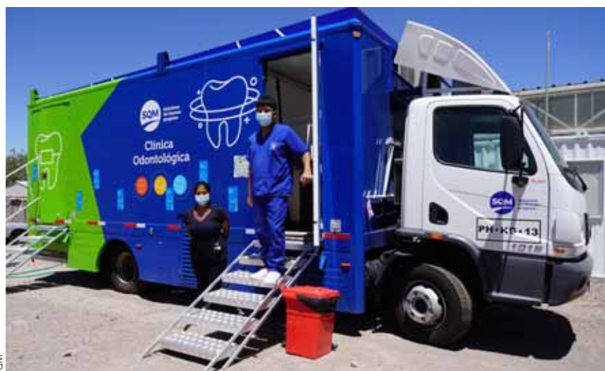
Tres móviles dentales dispone SQM para atender a cientos de familias de San Pedro de Atacama, Toconao, Peine, Socaire y Talabre.

posibles al reunirnos con una empresa comprometida con el territorio y un municipio que entiende que la colaboración es la clave".