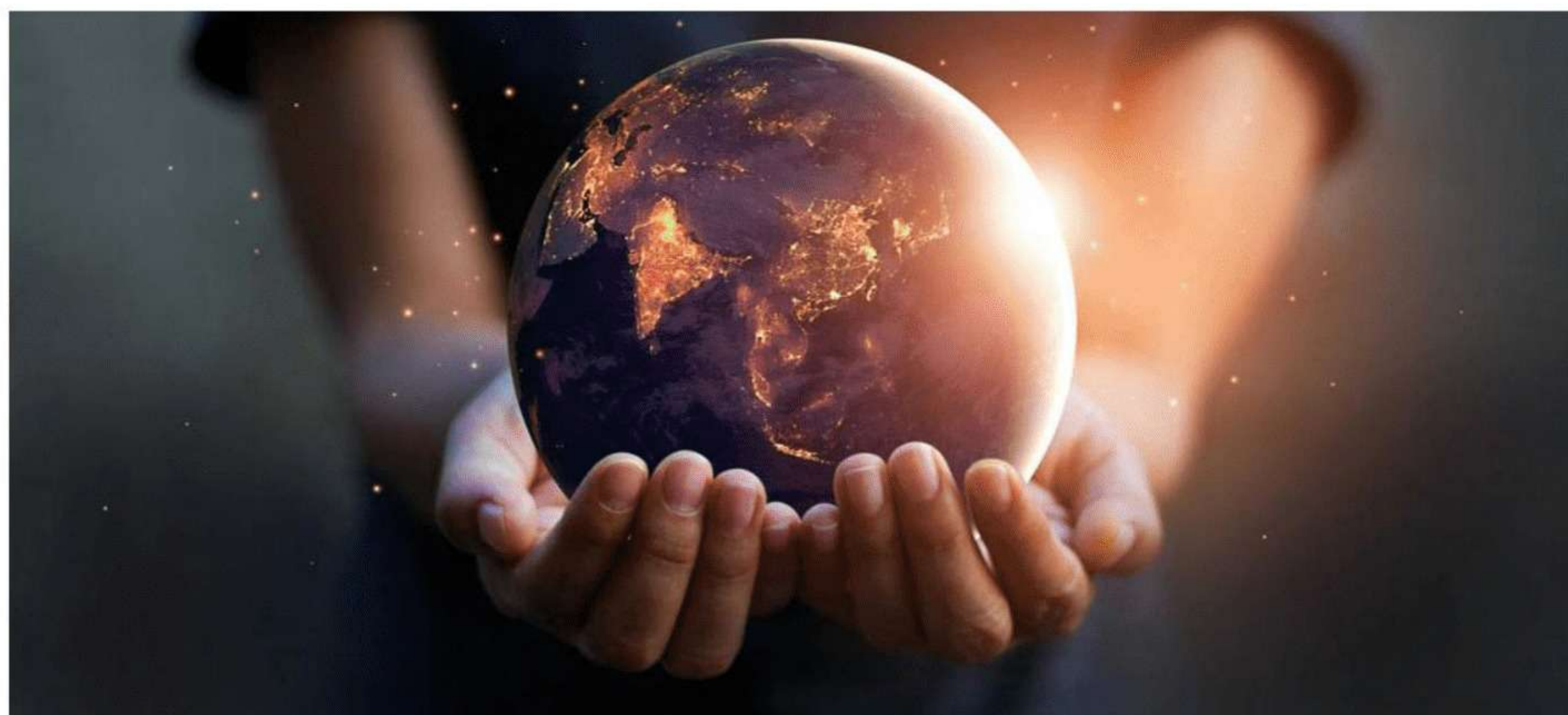
La “Visión 2050”, documento elaborado por el WBCSD, organización que Acción Empresas representa en Chile, ofrece a los negocios la oportunidad de acelerar y liderar las transformaciones que la humanidad necesita.

En ese contexto, las empresas están bien encaminadas. El 2020, 2021 y 2022 sirvieron para que avanzaran en materia de transformación y la sostenibilidad fue la mejor estrategia para sortear el reto. Valores intangibles como la resiliencia, la adaptación y la importancia del liderazgo para redefinir el rumbo de los negocios se transformaron en temas centrales de las mesas corporativas. Estos años sirvieron