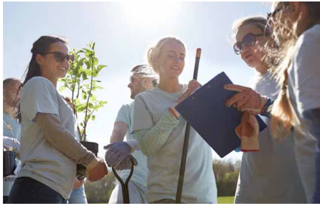
Desde 2021, Acción Empresas aborda el relacionamiento de empresas y comunidades a través de un programa de trabajo específico que busca el desarrollo de herramientas efectivas para propiciar el desarrollo local de empresas y territorios.

Según Cepal, los países en transición al desarrollo se caracterizan por tener altos índices de disparidad territorial que impactan en su nivel de ingresos, acceso a oportunidades educativas y laborales, lo que se traduce en altos índices de agitación y malestar. Por ello, abordar estas diferencias no solo depende de los recursos económicos y presupuestarios de gobiernos locales o empresas, sino que de variables más esenciales aun, como el diálogo.