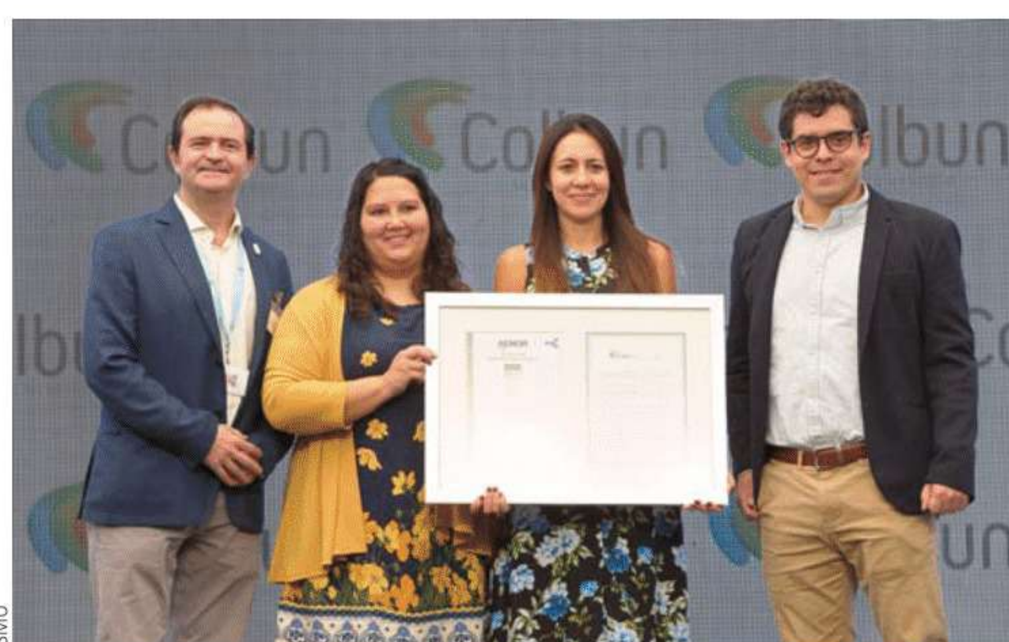
Certificación de SMU en la norma ISO 50.001:2018, que valida la implementación del Sistema de Gestión de Energía.

“En SMU nos desafiamos permanentemente a buscar nuevas formas de generar un impacto positivo y aportar a nuestros diferentes grupos de interés. Nuestro compromiso con la sostenibilidad empresarial nos impulsa a seguir avanzando en el