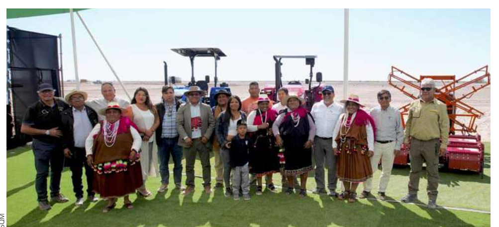
Actualmente la comunidad cuenta con 4 tractores y diversos equipamientos para optimizar los tiempos de arado, siembra y cosecha.

van más de 2 años de conversaciones en la Mesa de Trabajo, que ha construido 4 áreas de proyectos específicos, por eso estamos realizando hoy esta segunda entrega de maquinarias, la que se suma a siete cursos de capacitación, iniciativas construidas junto a la comunidad del lugar”, señaló el ejecutivo, agregando que hoy en día es imposible pensar en que exista una empresa como SQM si no existe una relación asociativa con el entorno humano que permita construir en conjunto un futuro más sostenible.