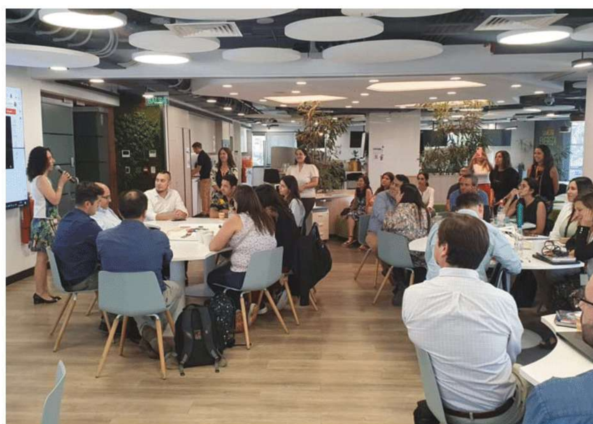
Primera sesión presencial del APL “Transición hacia la economía circular”, realizada en marzo pasado.

“Contar con una visión común y una coordinación que apunte en la misma dirección, teniendo siempre como eje el desarrollo