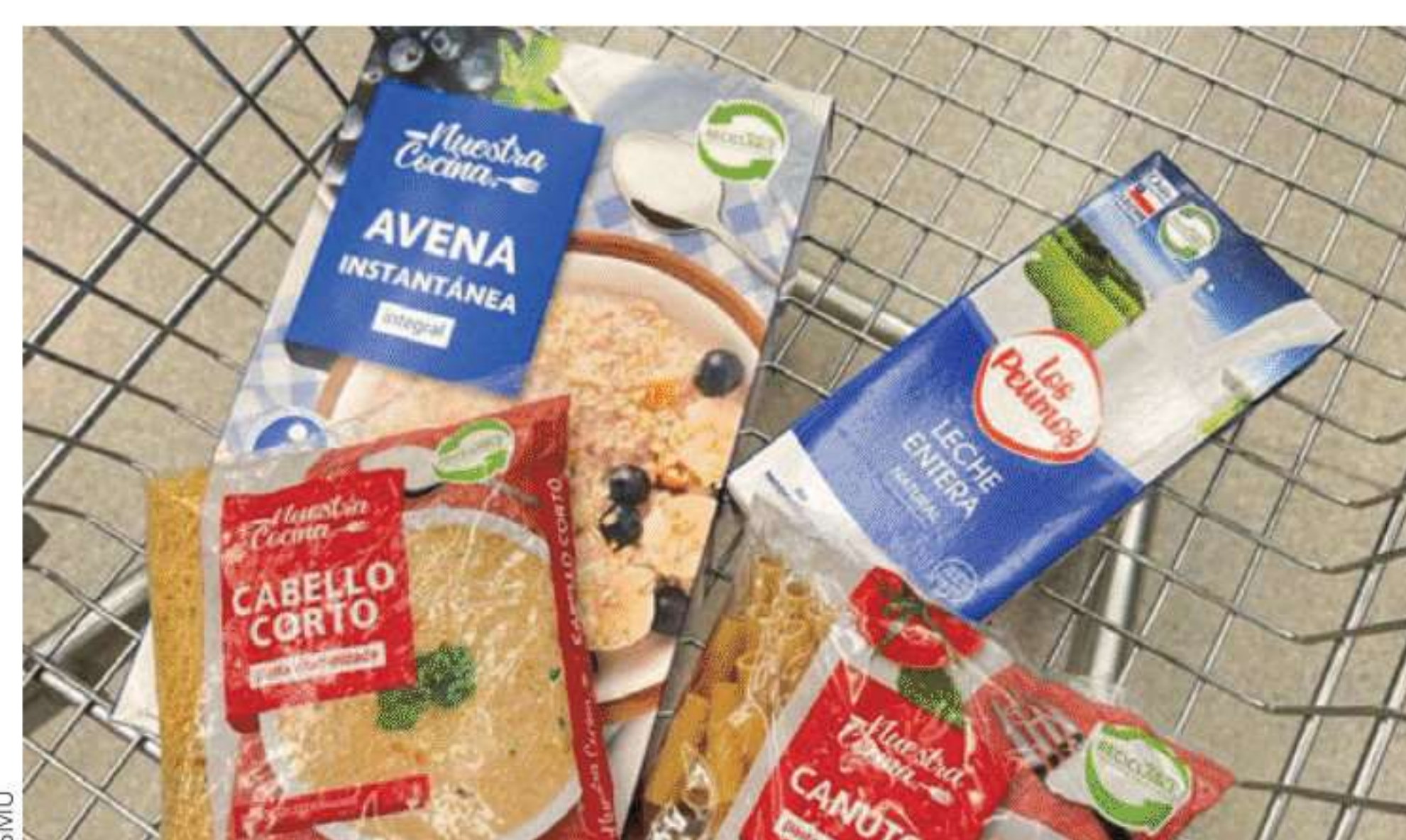
SMU ha certificado el envase de productos de marcas propias con el sello #ElijoReciclar.

Mediante un plan integral, SMU logró reciclar, durante el 2022, 16 mil toneladas de cartones, plásticos, maderas y aceites de 9 centros de distribución y cerca de 400 tiendas a lo largo de Chile. Adicionalmente, implementó otras iniciativas como la participación en el APL de Ecoetiquetado, a través de la cual ha certificado 230 productos de marcas propias como Nuestra Cocina, Amada Masa, Fundo Río Alegre, entre otras, con el sello #ElijoReciclar; la preparación para el cumplimiento de la Ley REP, y la adhesión al sistema de gestión de residuos