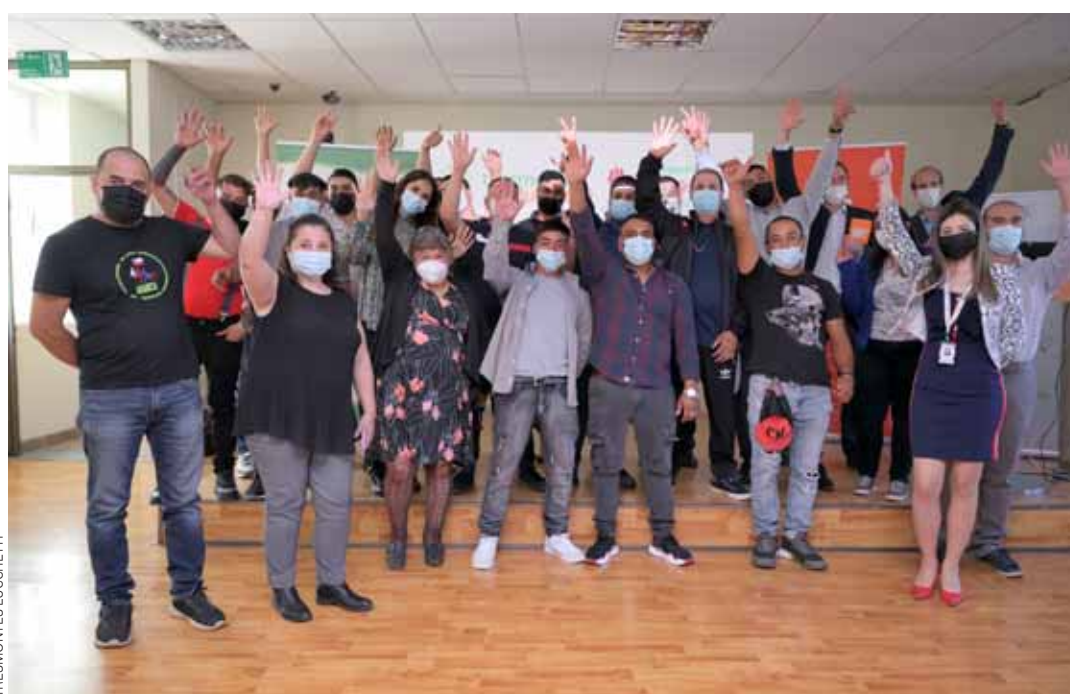
Graduación de recicladores de base del Programa Reposicionando.

Este modelo de relacionamiento contempla cuatro etapas: (1) comprender, (2) conectar, (3) actuar y (4) monitorear y reportar, procesos en los que se crean instancias de conversación y escucha activa con la comunidad. A través de su Programa Buen Vecino, la empresa logra comprender la realidad de la comunidad, sus recursos, necesidades y