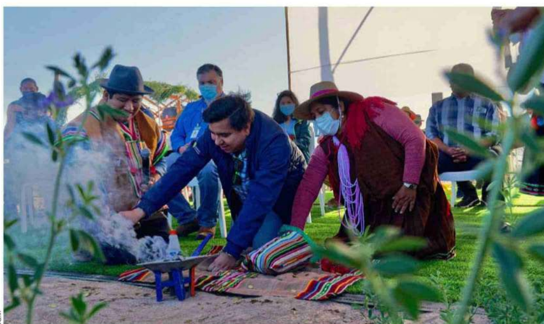
Este reporte representa el trabajo realizado en materia de sostenibilidad en el último año, siempre en sintonía con las comunidades aledañas a las faenas.