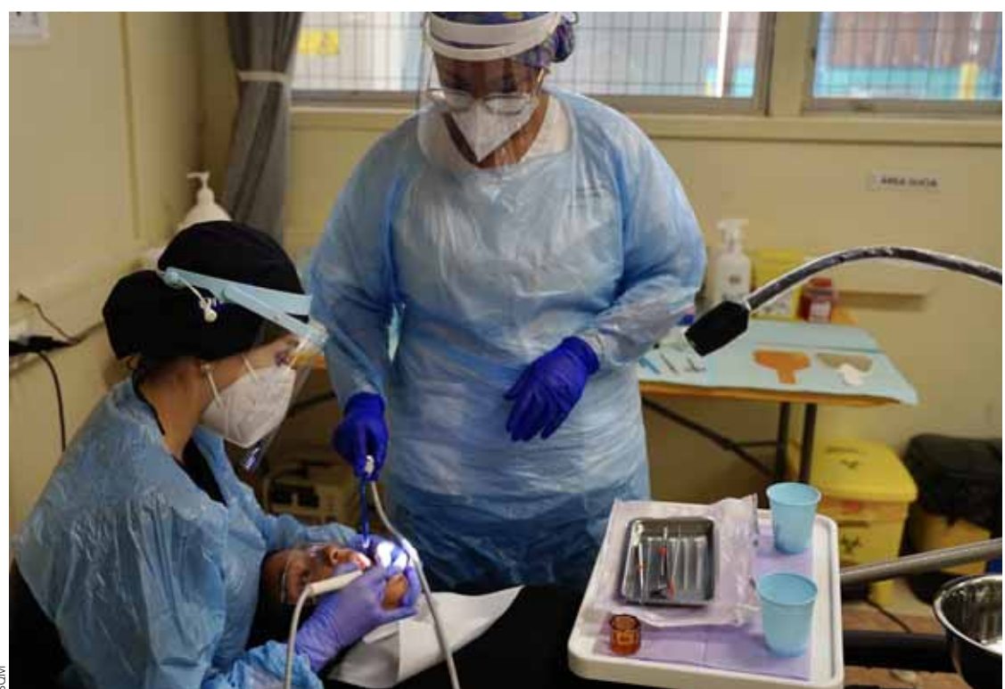
La Escuela Básica F-87 de Pozo Almonte ya inició con los operativos que buscan mejorar la salud bucal de cientos de niños en Pozo Almonte.