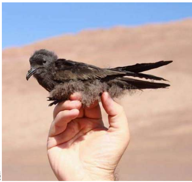
En Tarapacá es común ver a cuatro especies de golondrina de mar: collar, chica, peruana y negra.

El ejecutivo agregó que como compañía y en conjunto con organizaciones expertas como la Oficina de Protección de la Calidad del Cielo del Norte de Chile y la Red de Observadores de Aves y Vida Silvestre de Chile, se realizaron mediciones para determinar la “huella luminica” de las faenas, para no afectar a estas