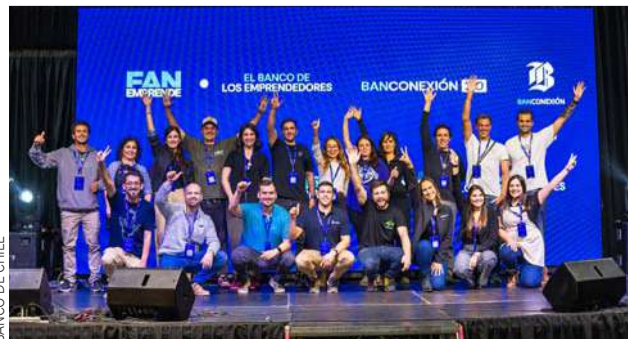
Concepción, La Serena y Santiago fueron sede de los tradicionales encuentros regionales, que regresaron después de cuatro años. En la foto los 20 finalistas de este año.

Fueron 27 mil postulantes, luego 200 seleccionados y por último 20 finalistas (10 de la categoría Desafío Local y 10 de la categoría Desafío Global). El 8° Concurso Nacional Desafío Emprendedor comienza a vivir desde abril su última etapa de la mano de una innovadora propuesta televisiva por las pantallas y redes sociales de Mega, Banco de Chile y Desafío Levantemos Chile.