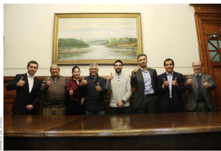
Cerca de 500 alumnos de 16 liceos técnico-profesionales fueron parte de la primera versión de la iniciativa, realizada en 2023.