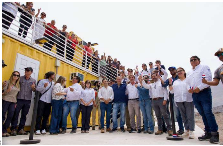
El centro, recientemente inaugurado, considera cinco profesionales: Directora, dos médicos veterinarias con experiencia en fauna silvestre, un licenciado y un técnico veterinario para turno de noche.

SAG, que se encuentra en difusión y que es parte de una campaña informativa orientada a proteger esta ave haciendo parte a toda la comunidad.