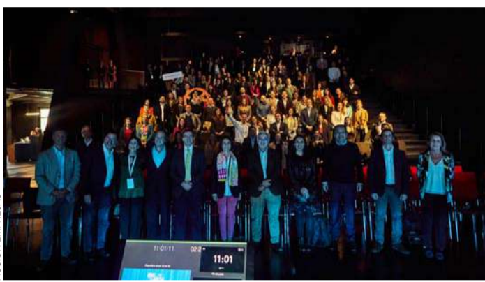
El 16 de abril, Acción Empresas realizará su XXIV Encuentro Anual.

En octubre de 2023 se lanzó —en español— el informe elaborado por la Comisión Empresarial para Combatir la Desigualdad (BCTI, por su sigla en inglés), conformada por líderes empresariales pertenecientes al Consejo Mundial para el Desarrollo Sostenible (WBCSD), organización que Acción Empresas representa en el país.