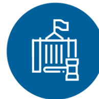
ÉTICA Y GOBERNANZA