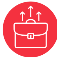
TRABAJO Y FUTURO