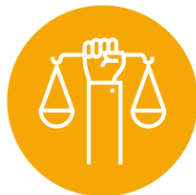
DD. HH. Y EMPRESA