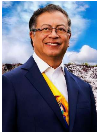
Gustavo Petro, presidente de Colombia.

Colombia se ha convertido en el primer país latinoamericano y el mayor productor de combustibles fósiles en unirse al llamado “ Tratado de No Proliferación de Combustibles Fósiles ” (Fossil Free Treaty).