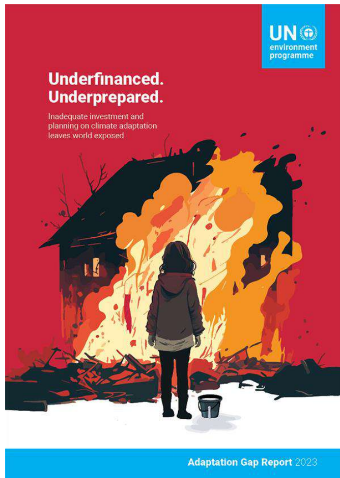
Informe del PNUMA presentado durante la COP28